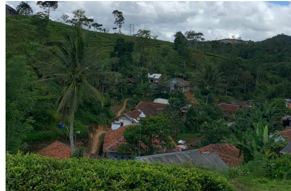
Gambar 6. Area wisata Kampung Warna