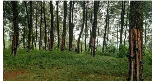
Gambar 5. Area Wisata Hutan Pinus

Dan destinasi wisata selanjutnya ada wisata kampung warna, disini adalah kawasan dengan pemukiman rumah warga yang diberi warna dengan warna-warni dengan beberapa fasilitas wisata lainnya. Lokasinya cukup dekat dengan wisata hutan pinus.