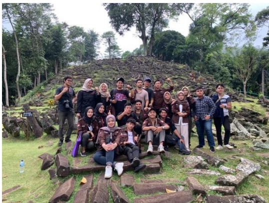
Gambar 1. Area Wisata Situs Gunung Padang

Menurut Akbar yang menarik dari situs Megalit Gunung Padang adalah situs Gunung Padang 10 kali lebih besar dari Candi Borobudur, dibentuk oleh 4 peradaban yang berbeda dan lebih tua dari piramida Mesir serta bangunan prasejarah terbesar di dunia. Situs Gunung Padang ialah bangunan megalitik atau punden berundak yang sudah lama ditinggalkan oleh warga pendukungnya. Situs ini dibentuk dari bebatuan vulkanik berupa andesit hitam. Ada lima teras di bagian atas situs, yang masing-masing terdapat susunan bebatuan seberat ratusan kilogram (Rusata, 2019).