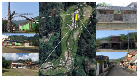
Gambar 3. Fasilitas eksisting di kawasan pintu gerbang

Pada kawasan gerbang wisata tentunya memerlukan fasilitas penunjang sebagai kawasan penerima. Adapun fasilitas pada gerbang Kawasan Situs Gunung Padang yang sudah tersedia, seperti: ticketing , halte , toilet umum, parkir mobil dan warung.