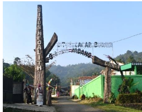
Gambar 2. Gerbang Kawasan Wisata Situs Gunung Padang

menyesuaikan dengan citra situs gunung padang yang menjadi daya tarik gerbang ini. Pada lokasi gerbang kawasan Wisata Situs Gunung Padang ini memiliki sedikit kemiringan kontur topografi, dan akses menuju gerbang ini cukup melewati beberapa jalan sempit yang hanya dapat dilalui satu mobil dan satu motor, namun pada gerbang Kawasan wisata jalan dapat dilalui oleh dua mobil yang berpapasan.