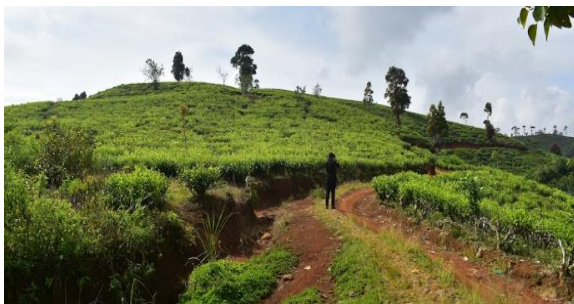
Gambar 4. Area wisata kebun teh

Wisata kebun teh ini berada tidak jauh dari gerbang wisata situs gunung padang. Wisata kebun teh ini adalah kawasan pertama pada destinasi Desa Wisata Karyamukti.