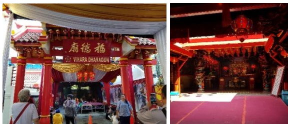
Gambar 7. Gerbang masuk Klenteng Hok Tek Bio (Vihara Dhanagun) dan Area dalam Klenteng

Karakter dapat di eksplorasi melalui suasana yang terbentuk dari elemen fisik suatu place (tempat) dengan mempertimbangkan lingkungan alami yang dimilikinya (Habibullah & Ekomadyo 2021:45). Ruko-ruko yang berderet membentuk koridor serta membuat karakter kawasan itu sendiri sebagai tempat perdagangan komersial menjadi semakin kuat.