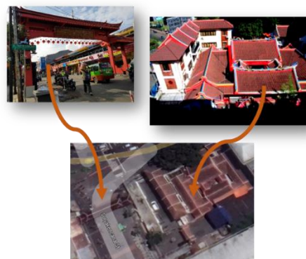
Gambar 5. Klenteng yang berada tepat disamping akses utama masuk kawasan

Deretan ruko memanjang membentuk koridor pada kawasan Suryakencana ini. Koridor dari deretan ruko tersebut membentuk garis linear yang berupa jalan lurus sehingga pengguna dapat mengaksesnya dengan mudah. Deretan ruko-ruko tersebut menjadi elemen pembentuk ruang kawasan sebagai focal point sekaligus backdrop kawasan yang dapat dilalui oleh akses jalan. Koridor yang tercipta dari susunan linear ruko yang berderet memiliki keunikan tersendiri dengan kawasan lain yang mana sama-sama memiliki ruko, contohnya pada kawasan sekitar Pasar Baru Bogor yang terletak di samping kawasan Suryakencana tidak membentuk koridor linear melainkan secara paralel mengelilingi bangunan Pasar Baru.