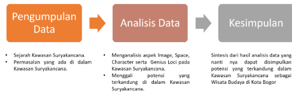
Gambar 1. Alur metode penelitian

Dalam pengambilan kesimpulan pada penelitian ini isu/permasalahan yang muncul dari pengklasifikasian tersebut akan melalui tahap analisis deskriptif melalui pengamatan pada unsur-unsur arsitektural Selanjutnya akan dianalisis bangunan-bangunan di sekitar kawasan Suryakencana dengan ciri maupun karakteristik desain dan arsitektur pecinan pada umumnya.