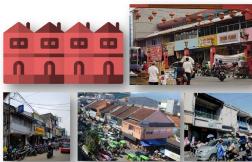
Gambar 6. Ruko yang berderet di sepanjang jalan utama kawasan