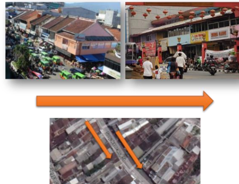
Gambar 4. Deretan ruko membentuk garis linear

Ruang dapat dijabarkan sebagai keunikan yang dimiliki suatu place (tempat) terhadap kondisi sekitarnya serta elemen fisik yang membentuknya. Aspek ruang dieksplorasi dengan mencari konektivitas yang terwujud dari elemen pembentuknya (Habibullah & Ekomadyo 2021:44).