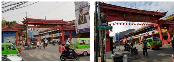
Gambar 3. Akses utama memasuki Kawasan Suryakencana dan Gapura Kawasan Suryakencana

Dalam menelusuri Genius Loci , citra merupakan salah satu aspek pertama yang dapat ditelusuri. Citra dapat diartikan keunikan visual yang menonjol dari suatu place (tempat) di mana keunikan visual dapat dirasakan dan kemudian dapat dideskripsikan visual yang unik untuk diobservasi (Habibullah & Ekomadyo 2021:43). Observasi dilakukan dengan menelusuri sekitar Kawasan Pecinan Suryakencana Kota Bogor pada ruas Jalan Suryakencana sebagai jalan utama. Citra kawasan ini memiliki perbedaan yang menonjol dari kawasan sekitarnya, baik kawasan Kebun Raya Bogor di seberang area akses masuk Pecinan maupun Pasar Bogor yang tepat berada di samping kawasan Pecinan.