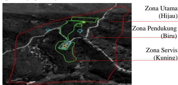
Gambar 2. Pembagian Zona pada Wisata Perkebunan Teh Gunung Manik

Lalu, untuk memberikan gambaran secara garis besar dari maksud yang telah diuraikan diatas, dapat kaji pada gambar 2.