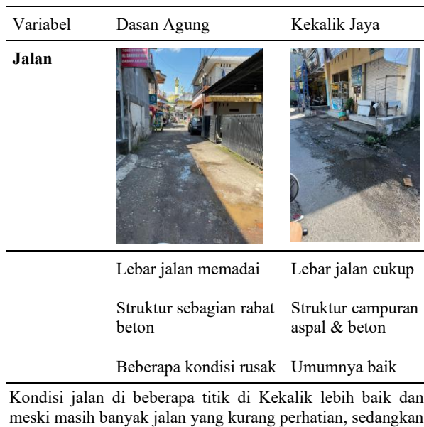
Tabel 1. Observasi Lokasi

struktur jalan Dasan Agung sedikit lebih kokoh di beberapa titik dan cukup terawat hal ini dikarenakan kawasan Dasan Agung yang terbilang cukup kecil sehingga lebih mudah untuk dipreservasi.