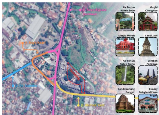
Gambar 7. Peta Destinasi Wisata Sekitar Terminal