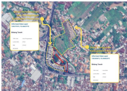
Gambar 5. Status Kepemilikan Tanah Sekitar Lahan

Berdasarkan hasil wawancara dengan narasumber, Terminal Tipe A Pandaan memiliki rencana terkait revitalisasi dengan memperluas lahannya menjadi 6 Ha, serta akan mengembangkan fasilitas penunjang yang belum tersedia. Dari rencana terkait revitalisasi, terdapat beberapa konflik di Terminal Tipe A Pandaan yang menghambat rencana tersebut. Salah satunya adalah konflik terkait status kepemilikan tanah yang akan digunakan untuk revitalisasi. Area pertokoan dan lahan kosong yang ada di sekitar terminal, status kepemilikannya masih belum dipegang oleh pengelola terminal. Sehingga masih menjadi penghambat terminal untuk melakukan revitalisasi.