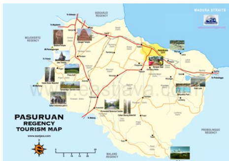
Gambar 1. Peta Wisata Kabupaten Pasuruan Tahun 2019

Salah satu kabupaten di Provinsi Jawa Timur yang memiliki banyak destinasi wisata adalah Kabupaten Pasuruan. Secara geografis, Kabupaten Pasuruan