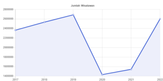
Gambar 2. Grafik Jumlah Wisatawan Kabupaten Pasuruan 2017-2022